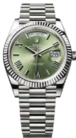
OYSTER PERPETUAL DAY-DATE 40 ΣΕ ΛΕΥΚΟ ΧΡΥΣΟ 18Κ